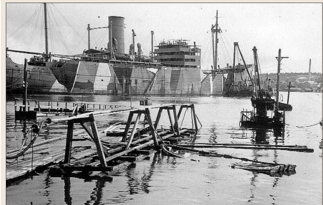
DS "ISAR": Troppetransportskipene "Isar" og "Donau" var ofte i Moss. "Isar" ble 2. mars 1945 angrepet av britiske fly ved Færder på vei sydover. Brann oppstod og den gikk til Værlebryggen. Her ble døde og sårede soldater og hester tatt i land - og brannen slukket. Den gikk så til Oslo. Kom deretter til A/S Moss Værft & Dokk for reparasjon 22. mars, og ses her med verftets flytekran og slepebåt "Trygve" på utsiden. I forgrunnen toppen av en av de sunkne flytedokkene.

Den kanadiske Troppetransport 6 av Bomber Command sendte 16 firemotors fly av typen "Halifax" med fire miner hver. Disse var tilpasset bombeopphengingen i flyene så disse godt kunne fly på bombetokt dagen etter. Flyene tok av rundt kl. 16.00, slapp minene rundt kl. 20.00 og landet tilbake på 63Base ca. kl. 23.00, altså en halv time før bombeangrepene begynte. To av flyene fra 424 skvadron minela Værla, de to andre Sundet. Alle fire fly fra