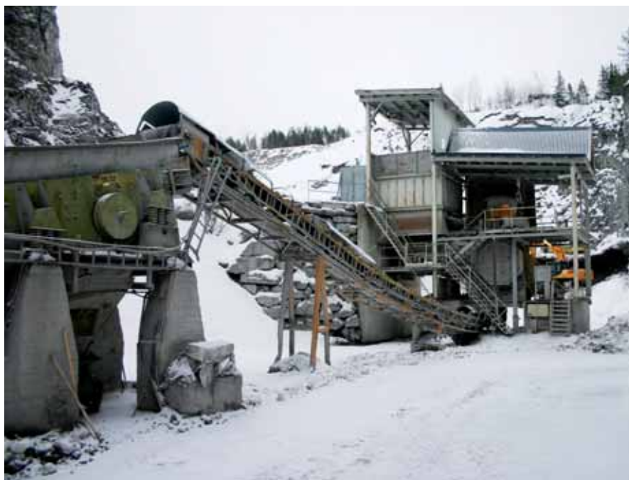
KALKVERKET: Den årlige totalproduksjonen ligger på 30.-40.000 tonn.

Han har derfor kunnet følge med på utviklingen av kalkverket gjennom mange år.