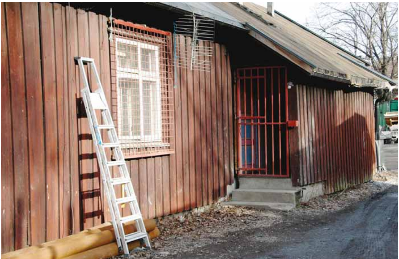
SOPPBEFENGT: Anleggskarene har dusj i et soppbefengt rom i kjelleren i dette huset.

I kategori fire, 10-20 ansatte, ble 10 arbeidsplasser registrert. Alle hadde spis-brakke, tre hadde ikke lomp. Ni arbeidsplasser hadde vann, én ikke. Det samme gjelder toalett. Halvparten av disse arbeidsplassene hadde dusj. Åtte hadde regelmessig renhold, to sto uten.