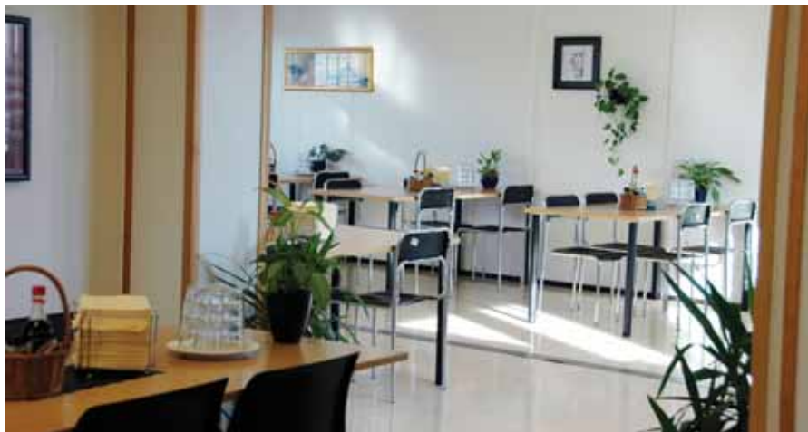
SPISEROM: I slike omgivelser inntar AF-ansatte anleggsarbeidere i Bjørvika sine måltider.

I kategori tre , seks til ti ansatte, var 40 ansatte med, 29 hadde spisebrakke/lomp, 11 hadde bare spisebrakke. 32 hadde varmt/kaldt vann, åtte hadde ikke vann. De samme tallene gjaldt også toalett.