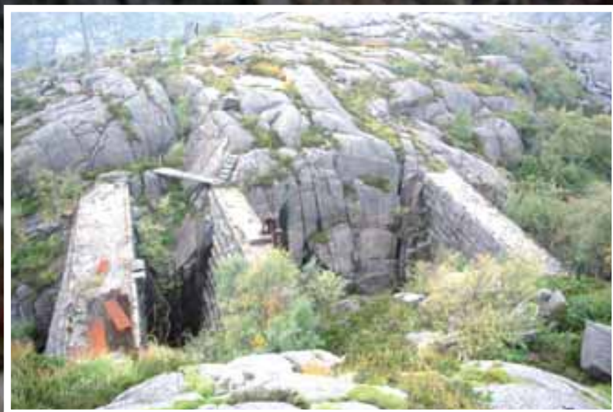
HISTORISK: Da det første kraftverket ble bygget, måtte de bygge trykkammer for å få ut luften før den ble sendt ut i rør ned til øvre stasjon. Dette er i dag noen mektig byggverk.