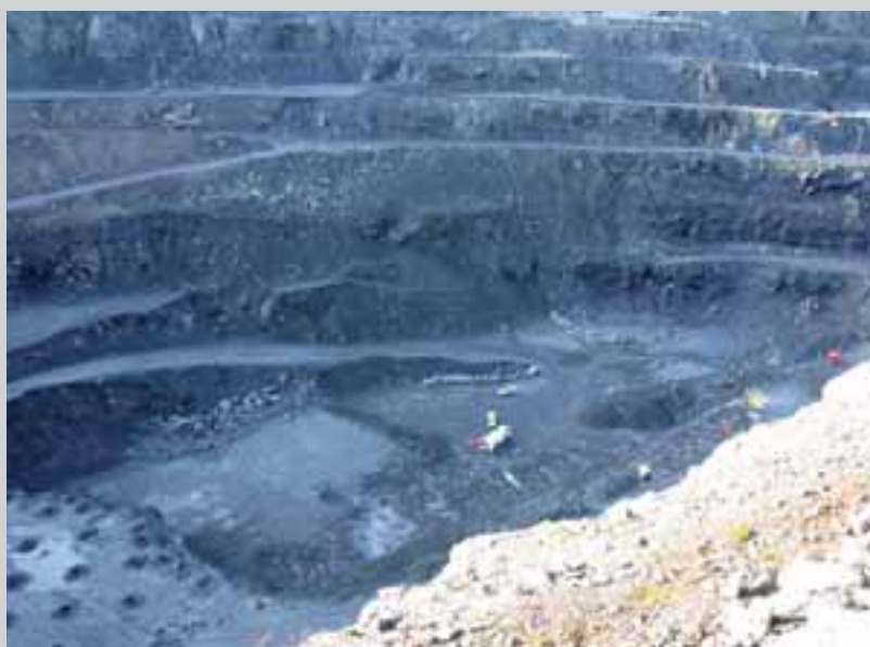
DAGBRUDDET: Her skal den planlagte konserten pågå.

Den 16. august kan mange musikkelskere virkelig glede seg til en liten sensasjon, for da synger verdensstjernen Katie Melua i dagbruddet til Titania på Tellnes i Rogaland.