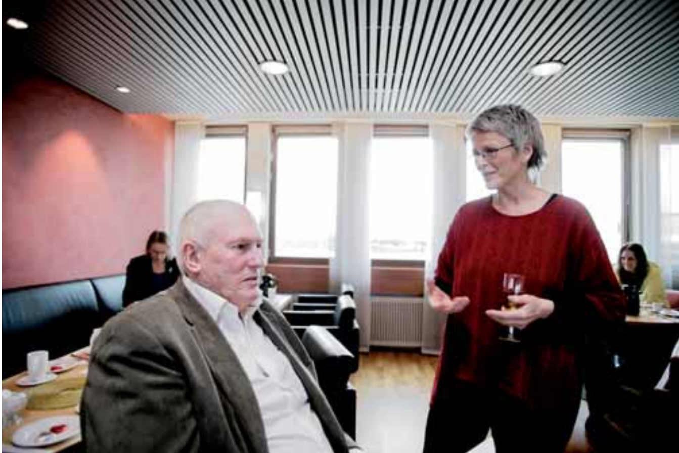
KOMPLISERT: Roar Flåthen var tilbakeholden med løftene til leder for Likelønnskomisjonens leder Anne Enger.