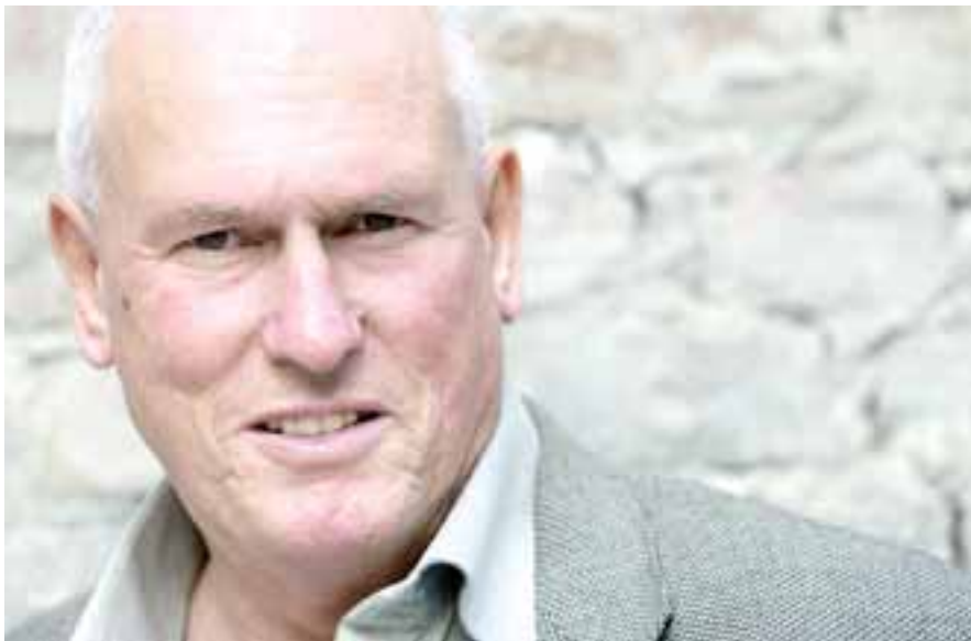
UAVSTEMNING er LO-leder Roar Flåthens mektigste våpen i forhandlingene, og mekling det største hinderet han må over før han kan sette sluttstrek for årets tariffoppgjør.

Først og fremst gjelder det en av fagbevegelsens aller helligste kuer; avtalefestet pensjon. Roar Flåthen har lovet de LO-organiserte en AFP-ordning som er «minst like god som dagens». Han vet – i likhet med alle de andre aktørene rundt forhandlings- og meklingsbordet – at uansett