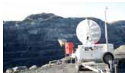
OVERVÅKNING: Den store radarskjermen svinger over den sørvestlige delen av det store dagbruddet på jakt etter ustabile områder.

Det siste året har Titania AS hatt store problemer med ustabile områder i det store dagbruddet på Tellnes. Produksjonen har en flyttet til deler av dagbruddet som ikke var i planen for året.