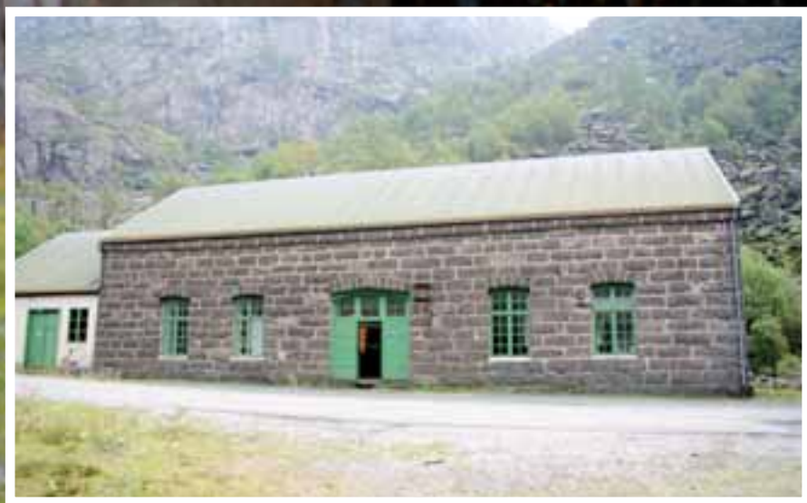
ÆRVERDIG: Den gamle ærverdige stasjonen skal inngå i det nye kultursenteret i Jøssingfjord.