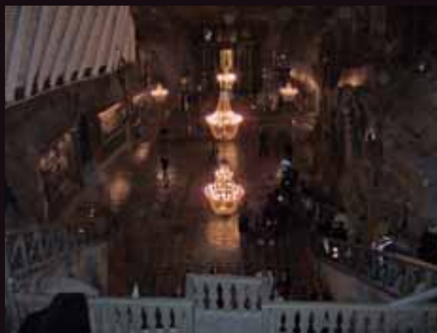
KAPELLET: I St. Kingas kapell, 130 meter under jorden, er alt laget i salt.