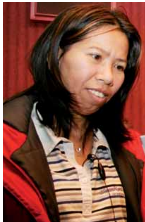
VI BLIR MED: – Klart vi blir med på den nye gruppeforsikringen.

– De fram møtte har vært en takknemlig gruppe å jobbe med. Gjennomgangstonen er at de vil være med på ordningen, erfarer