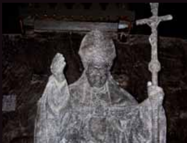
PAVEN: En statue av Pave Johannes Paul II (polakken Karol Wojtyła) er også hogd ut og står i St. Kingas kapell.

– Pust dypt og for hver gang du gjør, vil du leve tre minutter lenger på denne jord.