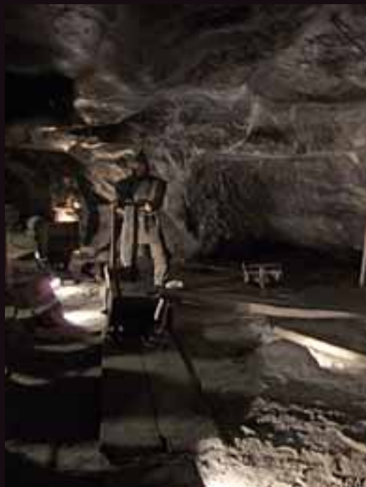
GRUVEARBEIDERNE: I løpet av årene har også sliterne i gruen fått sine minnesmerker.