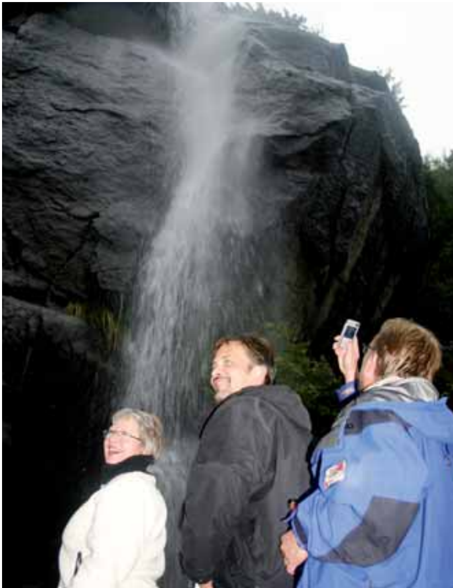
JETTEGROTTER: Det var de helt spesielle jettegrytene ut av Åna-Sira som var målet for turen.