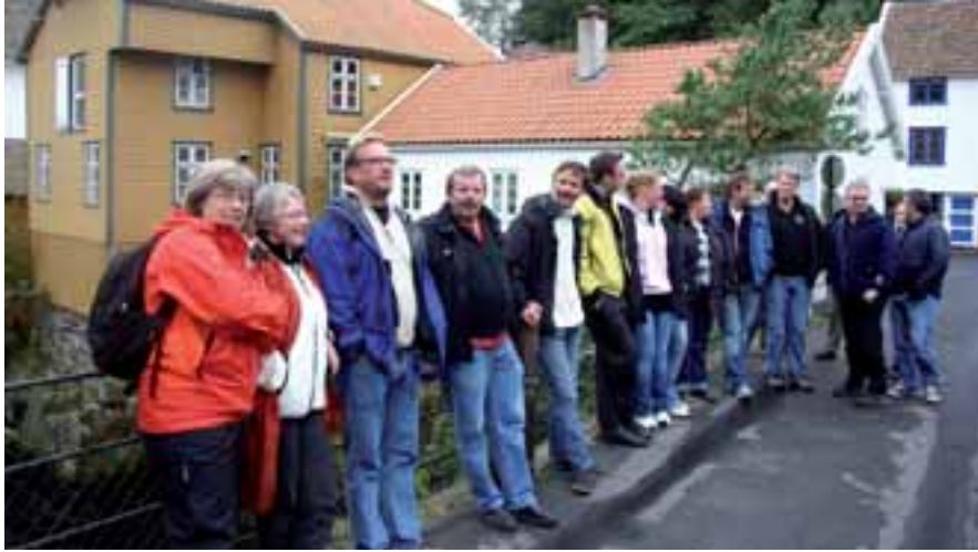
◀ PÅ BROEN: En spent forsamling venter på den gamle broen fra 1800 tallet i Sogndalsstrand.