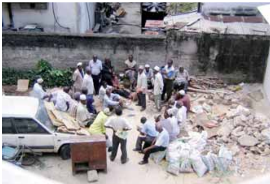
KURS: Finn en plass og bli med. Her faglig kurs i bakgården.