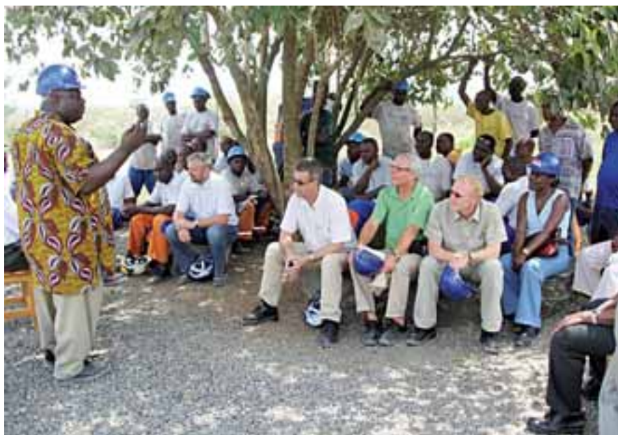
I SKYGGEN: Ansatte og besøkende tar seg en pause under et skyggefullt tre.