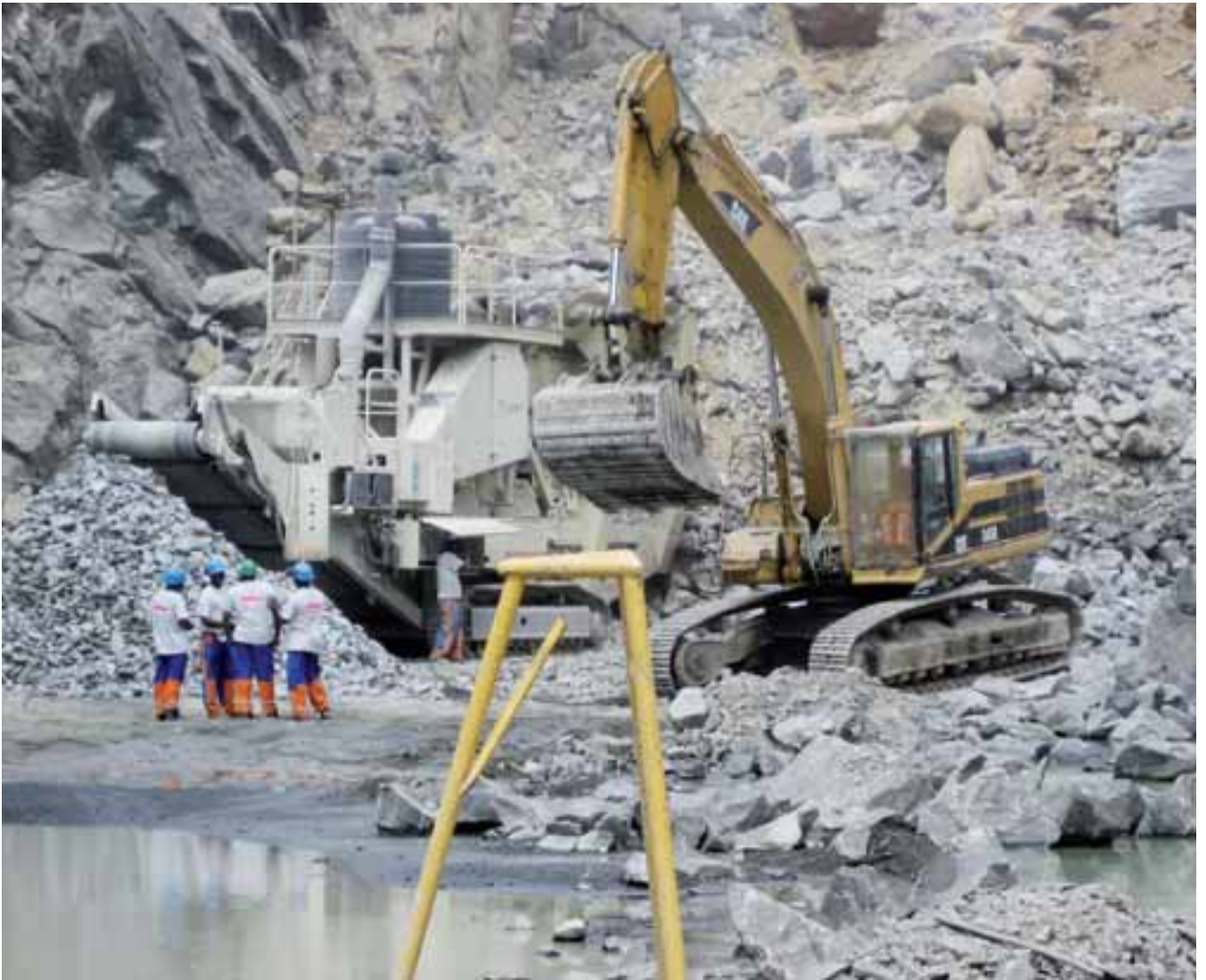
I STEINBRUDET: Ikke noe å si på maskiner og utstyr.