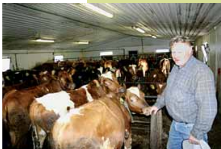
MASSE KYR: Fjøset er fullt av dyr både oppe og nede.