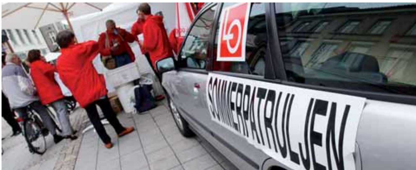
FÆRRE BRUDD: LOs Sommerpatrulje på stand i Sandefjord i fjor. Kun fire av 115 besøkte bedrifter Vestfold ble meldt videre til Arbeidstilsynet

LOs sommerpatrulje har i år oppdaget færre brudd på bestemmelsene i arbeidslivet enn før. Men de bruddene som avdekkes er like grove. I Trondheim unnlot 60 – 70 prosent av de besøkte bedriftene innen handel å betale overtidstillegg.