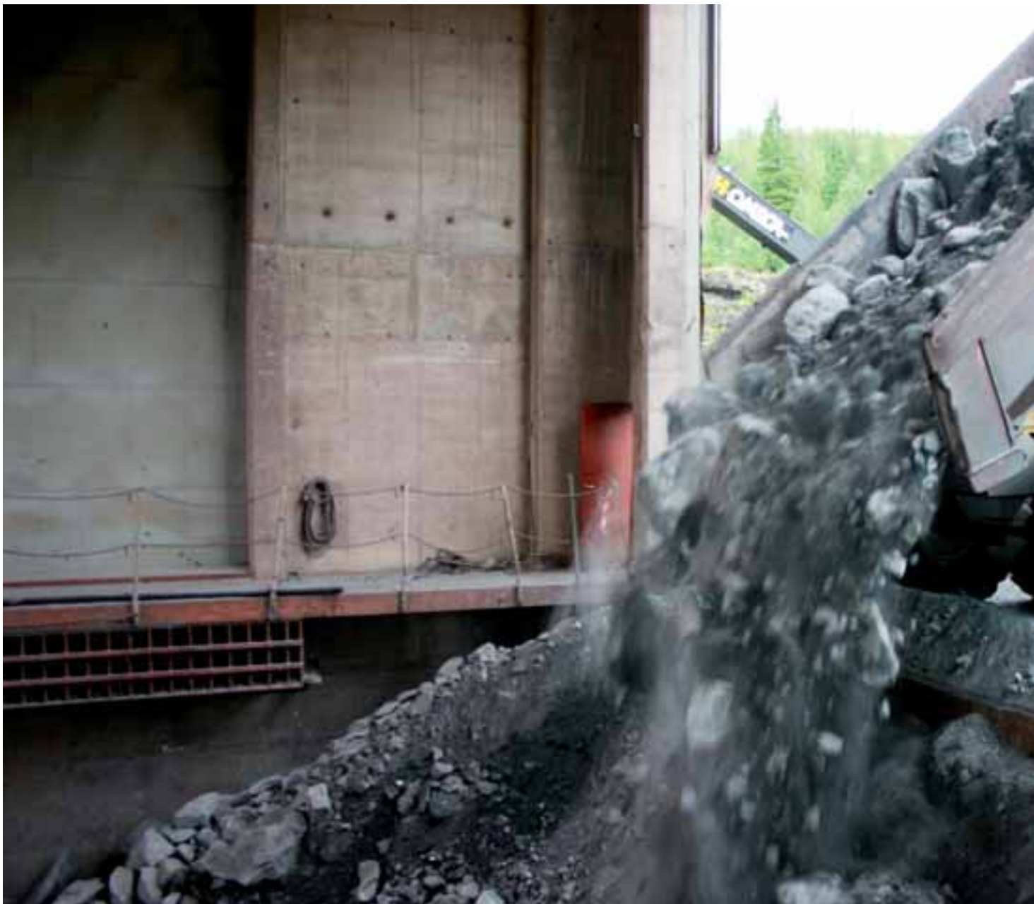
KNUSEREN: Malmen blir i dag kjørt ut til knuseren. Men med det nye driftsnivået må man også bygge en ny steinknuser inne i en stor fjellhall, fordi avstanden opp til dagen blir for lang.