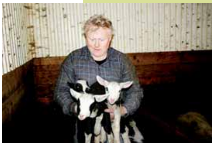
SØTE SMÅ: – Denne har fått trillinger. Er de ikke søte?