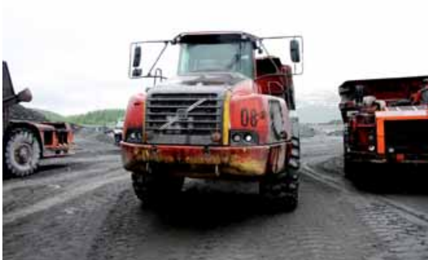
MONSTER: Det er dimensjoner over alt i Rana Gruber, inklusive lastebilene. Menneskene blir små i dette miljøet.