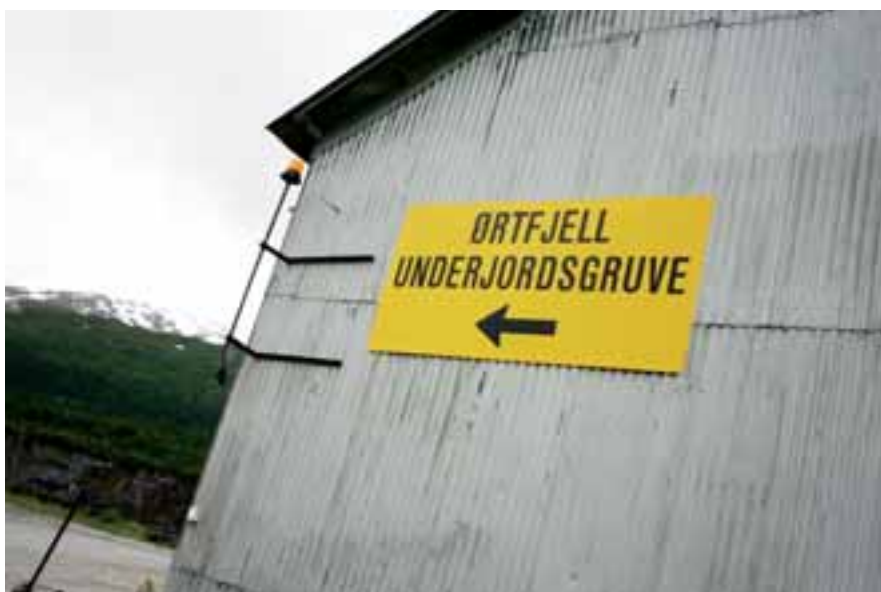
NYINVESTERING: Nyheten om storinvesteringen på hele 165 millioner kom like før fellesferien. Joda, det er fortsatt liv i Rana Gruber.