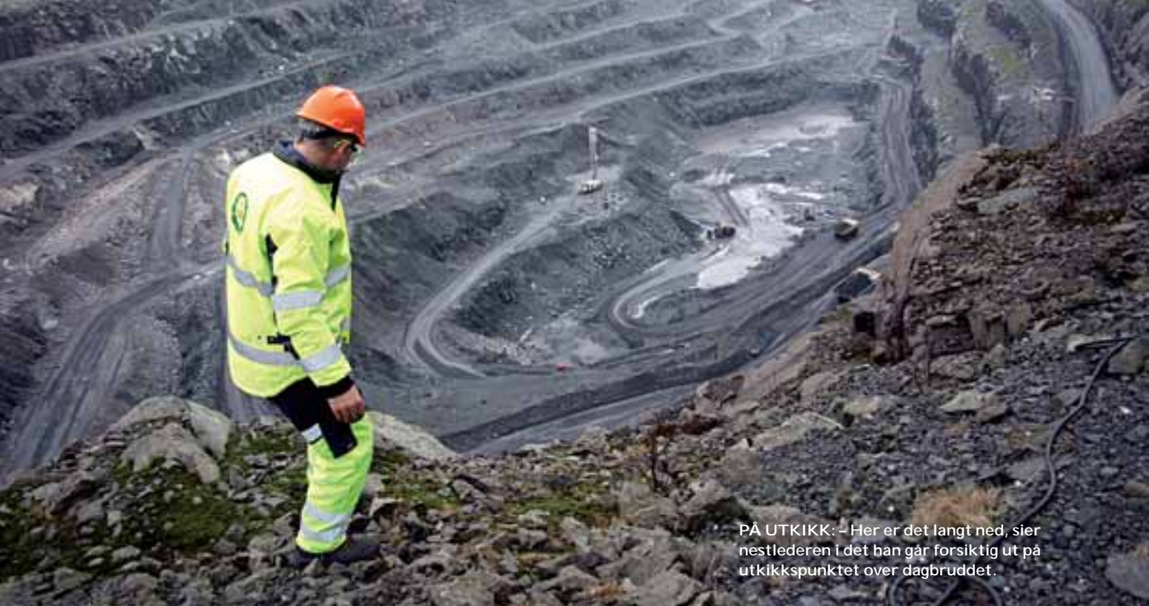
PÅ UTKIKK: - Her er det langt ned, sier nestlederen i det han går forsiktig ut på utkikkspunktet over dagbruddet.