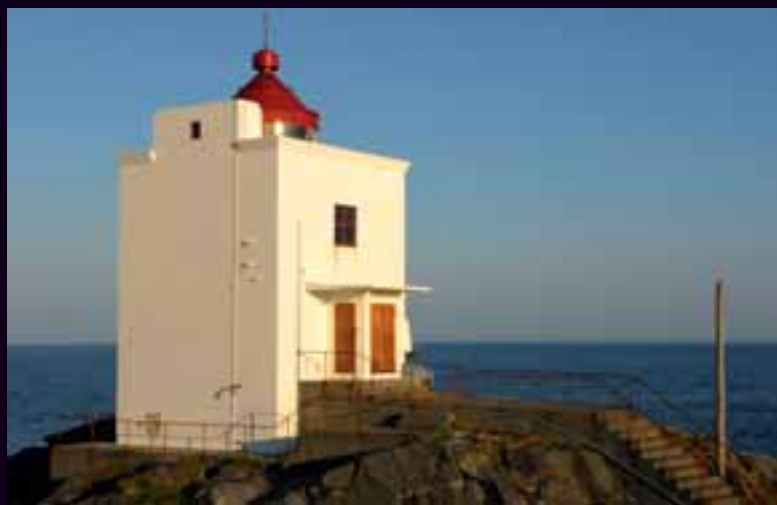
ULLA FYR: Dette fyret ble i sin tid etablert for fiskerne fra Haram på Sunnmøre. Nå er det overtatt av Norsk Arbeidsmandsforbund.