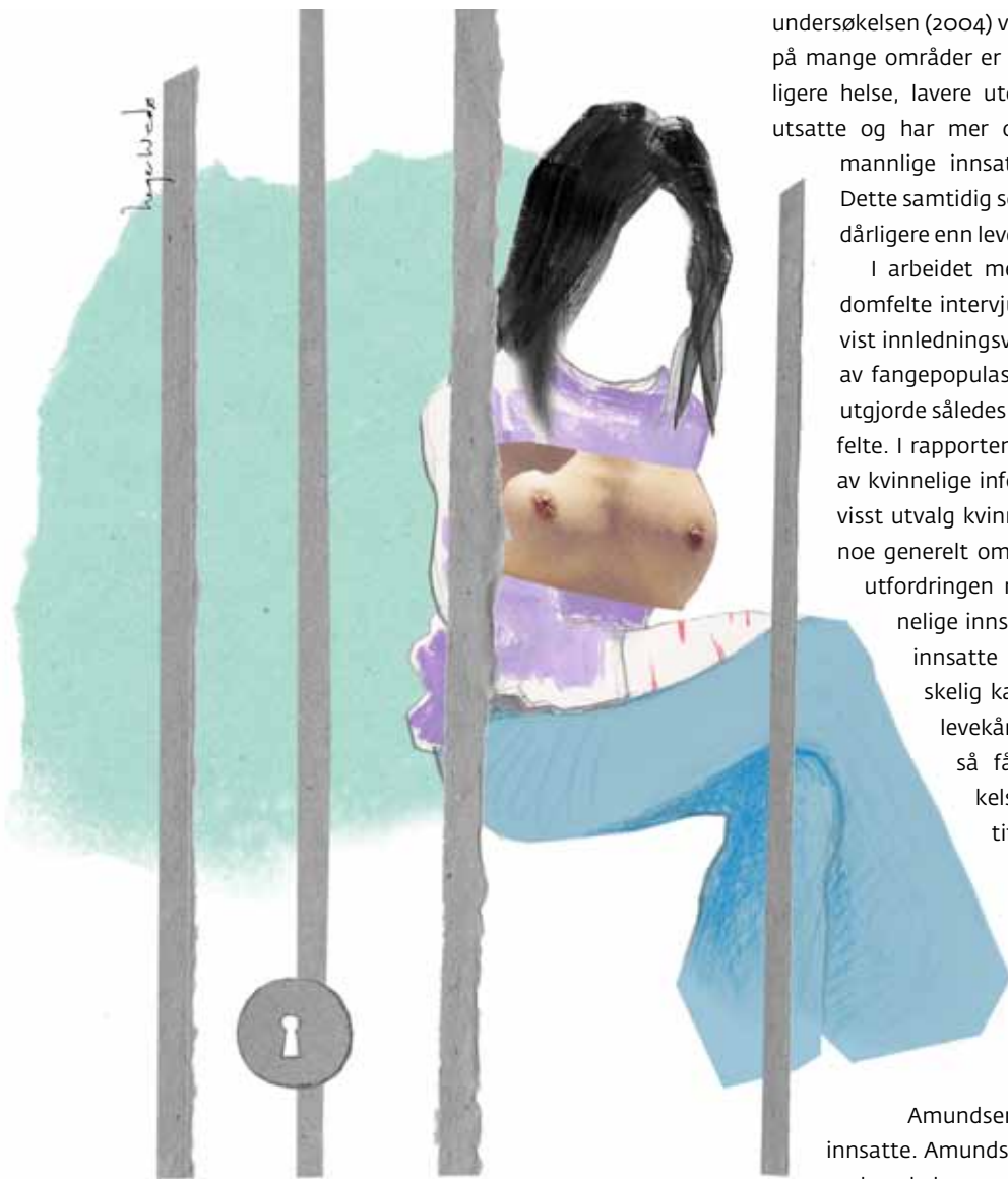
Illustrasjon: Hege Wedø

Amundsens funn blant hundre kvinnelige innsatte. Amundsen konkluderer, i likhet med Fafo-undersøkelsen, med at kvinnelige innsatte utgjør en svært marginalisert gruppe. Blant annet viser hun >>