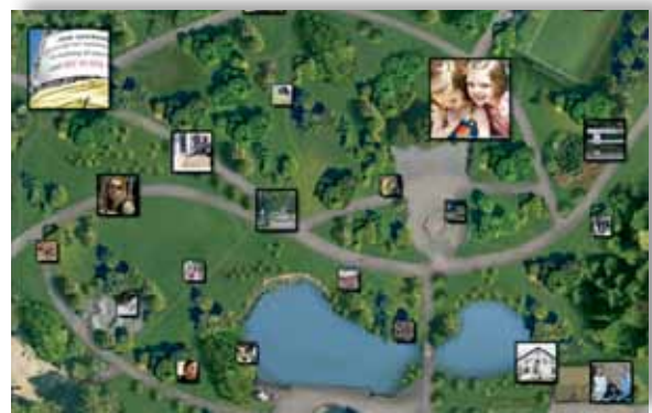
Illustrasjon 7: The Green Park Community – kart format

Disse tre modulene inngår i det vi har kalt en internasjonal fordypning i bachelorprogrammene. Til sammen har studentene mulighet for å ta 30 studiepoeng (et halvt år) som nettstudent. I tillegg har studentene tilbud om å ha praksis utenlands og gjennomføre kortere studier hos en av partnerinstitusjonene (inntil 30 studiepoeng). En slik internasjonal fordypning kan om ønskelig avsluttes med at studentene skriver sin bacheloroppgave på engelsk med et komparativt internasjonalt perspektiv på sosialt arbeid. Alle studenter gjennomfører det første studieåret ved sin nasjonale høgskole før de begynner på fordypning, og de tar sin avsluttende eksamen ved sin hjemmeinstitusjon.