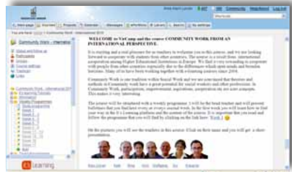
Illustrasjon 2: Bildet viser strukturen i SSS og opplagstavlen i kurset.

benyttet, valgt. Studenter og lærere kommer inn i kursene gjennom en egen Internettadresse.