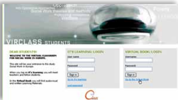
Illustrasjon 1: Påloggingside til SSS og Virtuelt læringsmateriale.

Utviklingen av stadig bedre nettbaserte studiestøttesystem (SSS) har etter hvert gitt mulighet for å skape gode læringsarenaer via Internett. Da vi startet de internasjonale nettbaserte kursene i 2004, var det ingen partnerinstitusjoner som brukte det samme SSS. Av praktiske grunner ble derfor It's learning som Høgskolen i Bergen