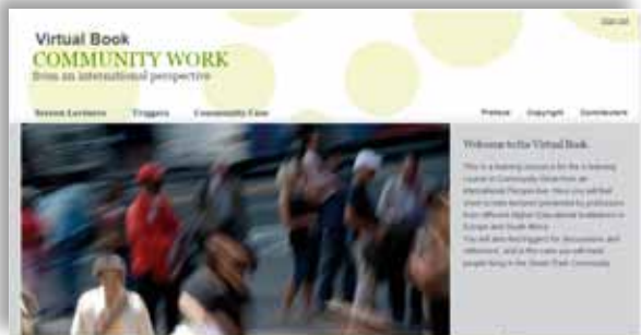
Illustrasjon 4: Virtual Book – Community Work from an international perspective.