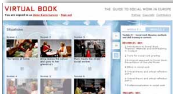
Illustrasjon 5: Tolv kasus scener for modul 2.

«I think the Green Park Community Blog provides a chance to put into practice the theories we learn. It also give us access to people thoughts, feelings and impressions about their community and this is really important information for community workers» (Midtevaluering, CW 2010).