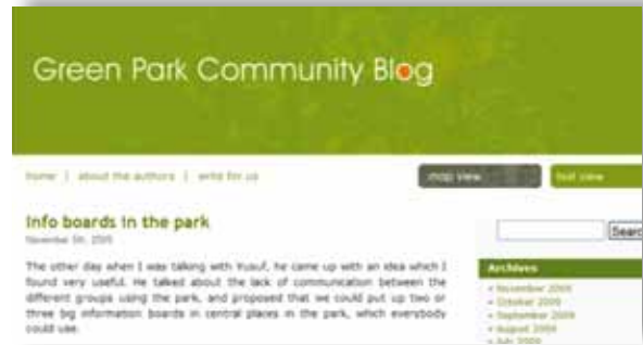
Illustrasjon 6: The Green Park Community blog – tekst format