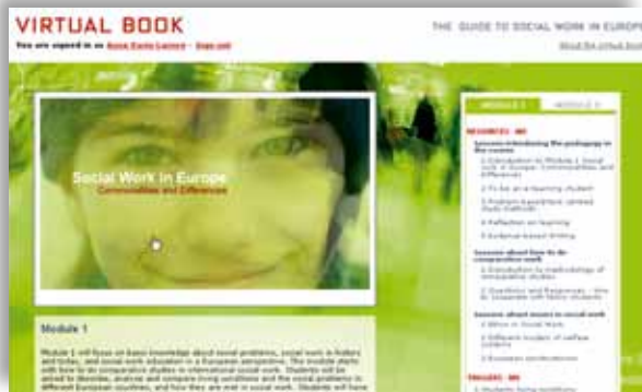
Illustrasjon 3: Virtual Book – The Guide to Social Work in Europe